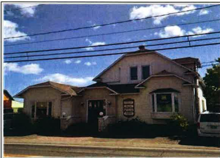
PHOTO DE COMPARABLE N° 3 679-379C blv PERRON CARLETON, QC G0C1J0