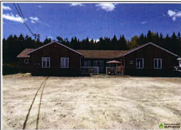
VUE DE LA RUE