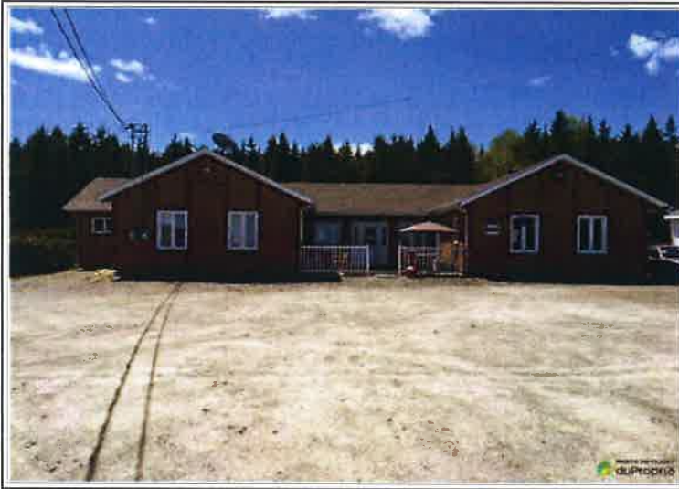
FACADE DE LA PROPRIÉTÉ VISÉE