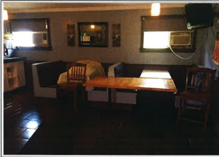
salle à diner/ resto