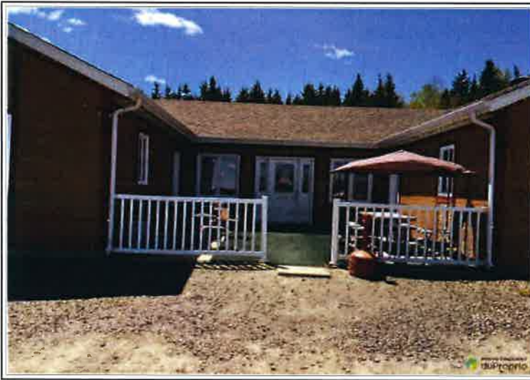
ARRIÈRE DE LA PROPRIÉTÉ VISÉE