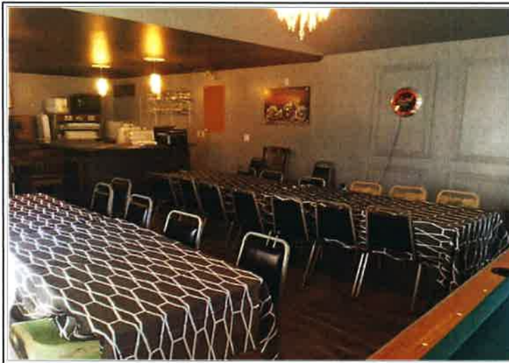
salle à diner