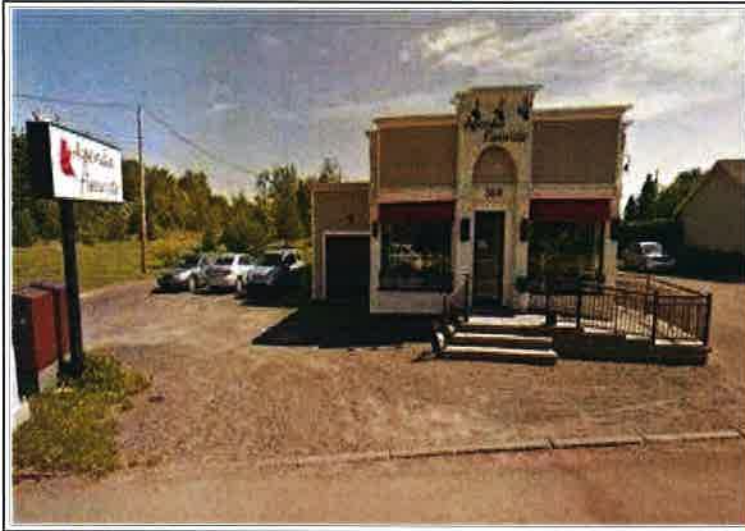
PHOTO DE COMPARABLE N° 2 564-566 blv PERRON MARIA, QC G0C1Y0